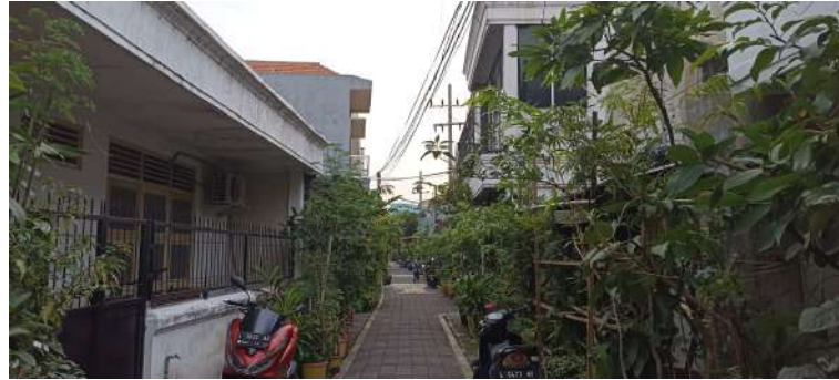
Gambar 3. Jalan Gang Kawasan Kampung Maspati.

Jalan gang kawasan hanya sekitar 3-4 meter dan menggunakan batu paving. Jalan ini menjadi akses lalu lalang warga dan pendatang untuk menyusuri setiap gang yang ada. Biasanya pada hari tertentu dan didatangi oleh tamu undangan, jalan gang ini akan dipakai untuk kegiatan pengenalan kawasan dari segi historis budaya dan pelestarian adat.