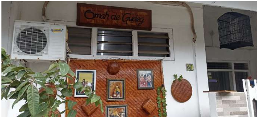
Gambar 5. Bentuk Teritori Primer Menjadikan Rumah Huni Tempat Tinggal dan Area Historis

Dalam permasalahan mempertahankan teritori ini tampak semakin kuat menunjukkan adanya tanda kepunyaan teritorial, contohnya memberikan tanda atau simbol sebagai menghindarkan ancaman perusakan fasilitas dan menuntut mengikuti kebiasaan atau istiadat yang diterapkan. Hal ini artinya bertujuan untuk melahirkan rasa hormat dan menghargai terhadap teritori tersebut.