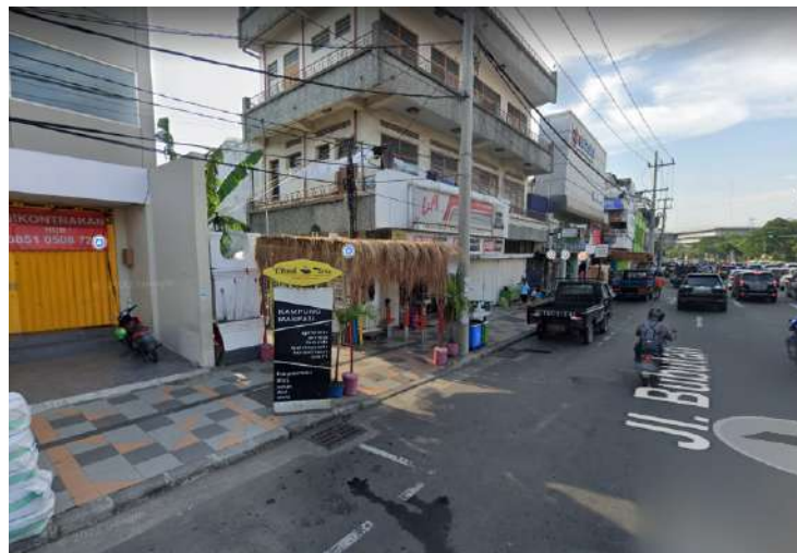
Gambar 2. Trotoar Sekitar Kawasan Kampung Maspati.

Trotoar mengelilingi setiap tepi kawasan yang digunakan oleh warga setempat maupun sekitar hendak berjalan kaki ataupun menunggu jemputan transportasi umum.