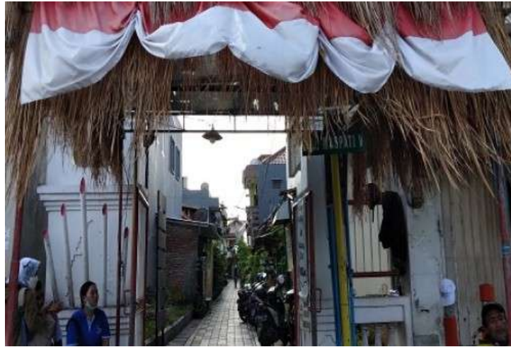
Gambar 1. Akses Utama Masuk Kampung Maspati.

Jalan utama kawasan ini menjadi akses keluar masuknya warga dan pendatang yang ditandai dengan adanya gerbang dari material bambu yang menamai setiap gang yang dihubungkan