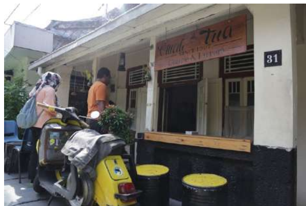
Gambar 6. Bentuk Teritor Sekunder Menjadikan Area Mencari Penghasilan dan Memanfaatkan Area Publik

Teritori dari kawasan kampung Maspati dapat terlihat dari aktivitas yang terbentuk dari kawasan secara fisik meninggalkan jejak sebagai gambaran aktivitas warga dan masyarakat itu berlangsung. Ini bisa dibagi menjadi beberapa macam adanya teritori di suatu kawasan yaitu teritori primer, sekunder, publik Masyarakat Kampung Maspati. Teritori primer berhubungan dengan sifat bangunan atau area yang mana selain berfungsi sebagai area mencari pendapatan juga sebagai tempat tinggal yang bersifat mempertahankan wilayah. Ini bisa dilihat pada bentuk fisik seperti rumah 2 lantai dengan lantai 1 dimanfaatkan sebagai area toko dan lantai 2 dimanfaatkan sebagai tempat tinggal. Teritori primer juga bisa dilihat dari peran penghuni sebagai menjaga toko dan melayani pembeli. Toko memperhatikan peletakan barang-barang jualan agar tidak sampai berceceran hingga ke area pedestrian atau jalan gang.